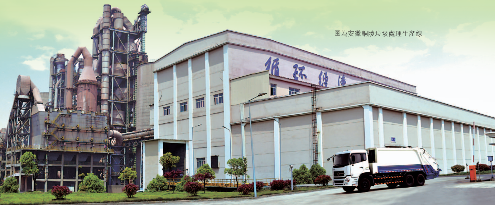
圖為安徽銅陵垃圾處理生產線

新型建材產業將繼續結合不同客戶群體需求對工藝流程進行優化調整，實現產品種類多元化，不斷提升產品附加值。在銷售市場拓展方面，將順應「互聯網+」的發展趨勢，加大對媒體廣告的投入力度，試水網絡營銷；同時，通過加強市場拜訪，儲備後加工企業潛在客戶，爭取更多業務訂單，努力盡快實現利潤貢獻。