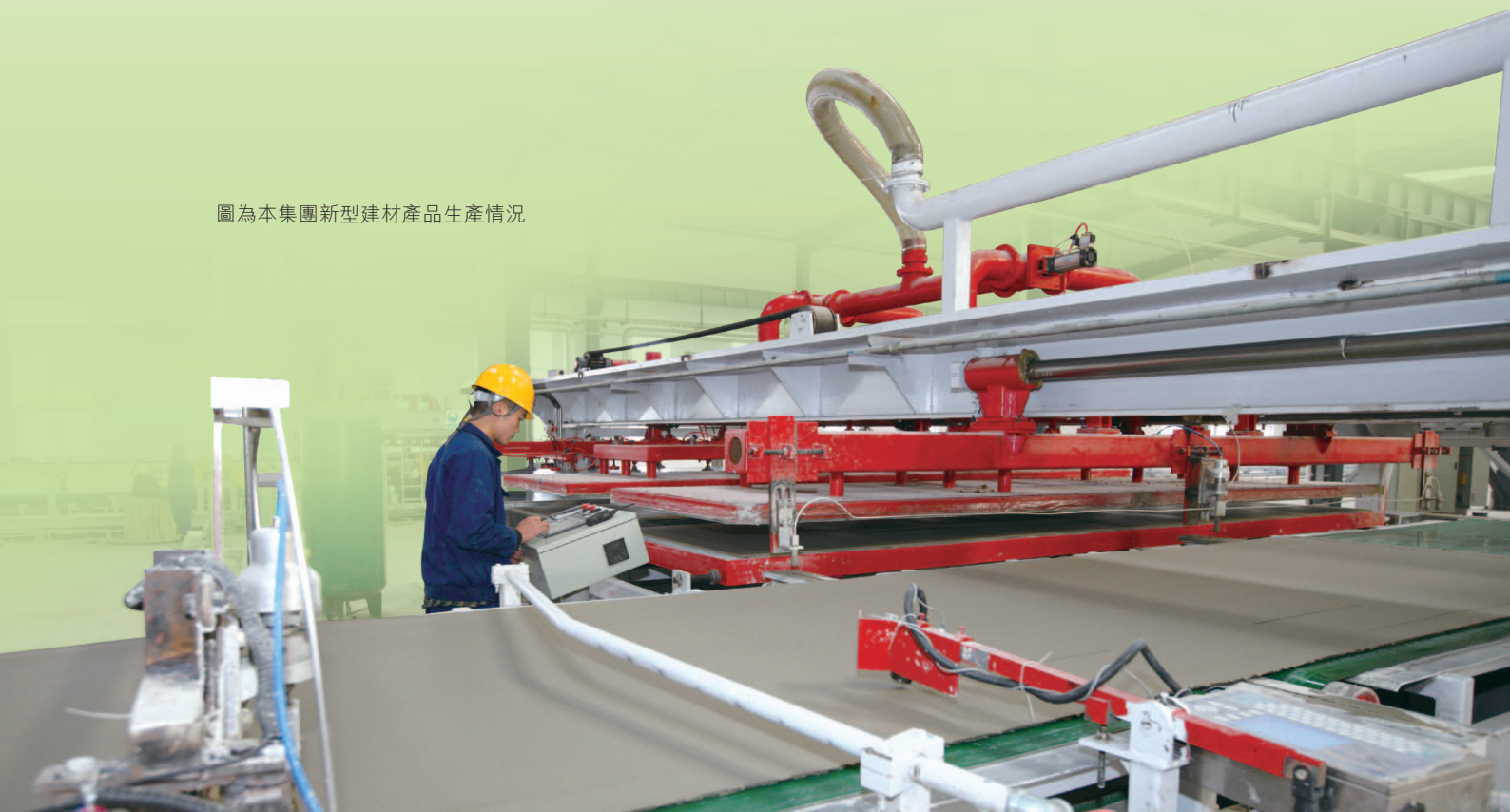
圖為本集團新型建材產品生產情況

報告期內，本集團積極開拓港口物流業務貨源，通過不斷加大技改投入，實現吞吐量1,076萬噸，實現營業收入人民幣7,279.00萬元。